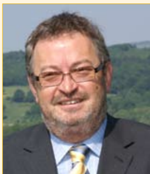
Bürgermeister Franz Engelmaier