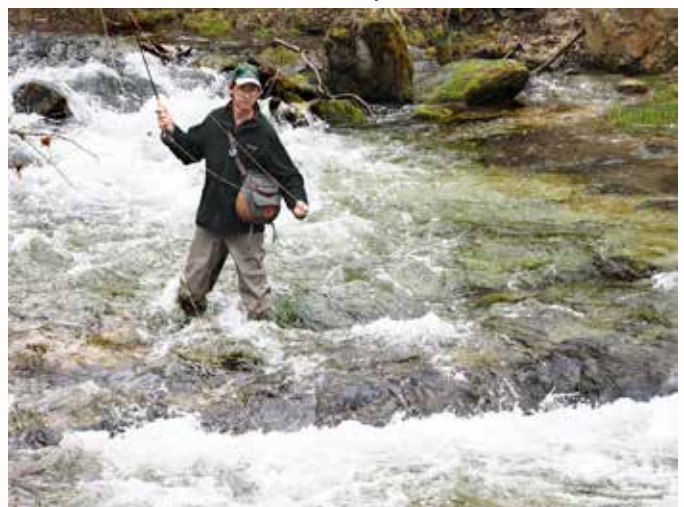
Foto v.l.n.r.: Fliegenfischen in der Erlauf