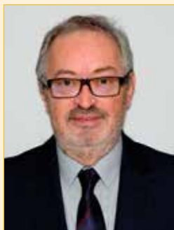
Bürgermeister Franz Engelmaier