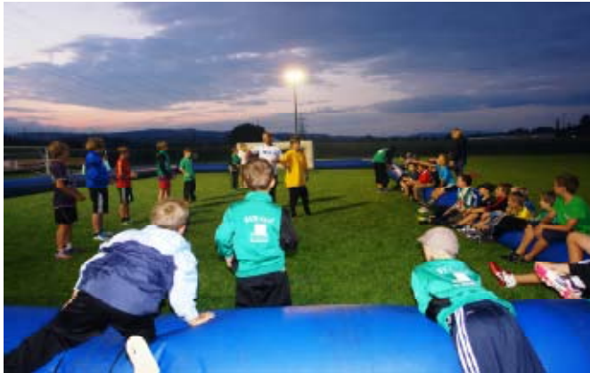
Lagerfeuer mit anschließender Übernachtung in den Zelten - ein aufregendes Erlebnis.

Vom 22. - 24. Juli 2011 ging es auf der Anlage des Sportverein Erlauf so richtig rund. Ein Zeltlager und ein Ferienspiel standen am Programm, das von den Verantwortlichen des SVE-Nachwuchses vorbildlich organisiert wurde. Mini-WM, Geschicklichkeitsspiel und ein Teambewerb sorgten für ausgelassene Laune.